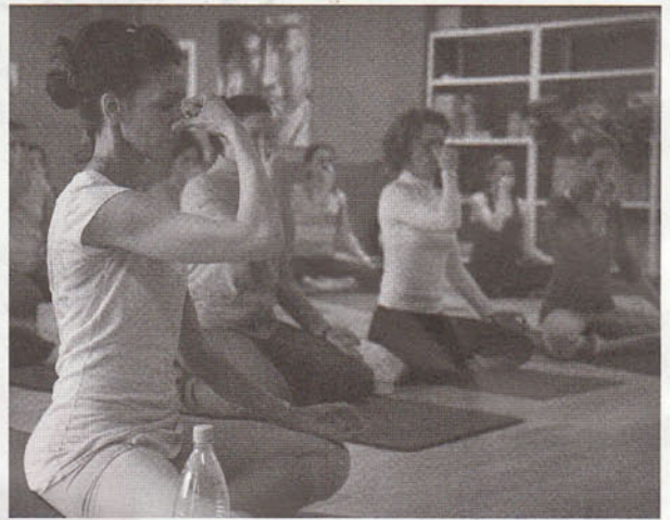
ハンブルグ、ドイツ プラナヤマのワークショップ

ヨガのプラクティスをしているとき、我々が何に惹かれているのかは明白だ。ヨガは他との境界線がどのように解けて、消滅しうるかの理解へと私たちを近づけ、つながった感覚をもたらす。他者との関連で自身の存在を存分に認めさせてくれる。 私は二つの文化を持つ家族の元、仕事と娯楽、双方において広範囲に旅をする両親に育てられた。両親は名所や文化を探索することが大好きで、その経験をとおして自らの人生に新しい視点を取り入れていった。二人の影響は今日でもなお、私の中に残っている。 私が初めてヨガに接したのは、1990年代初頭の東南アジアだった。そのときヨガの哲学が私の生き方にピッタリと一致し、好奇心をかきたてた。それは単純に旅をすること、ヨガが一致したということではなく、私にとつての、探求し、学び、自身の可能性を体現するために必要となる探究心／好奇心が、それと似通っていると感じたのだ。 ヨガを教え始めるにつれ更に、旅をし学ぶ、という欲求は高まっていった。私は指導者であるが、もはや他に学ぶことは何もないと感じたことは一度も無い。むしろ学び分かち合う準備ができている人々と、ワークショップやクラスで初めて接する度に、彼ら彼女ら、そして体験そのものから、どれほど多くのことを得ることができるか、それを考えるだけで心からワクワクしてくる。