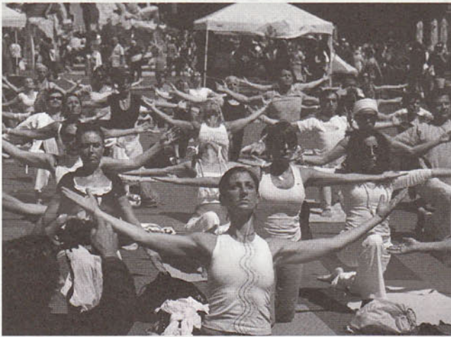
Piazza Navona, ローマ、イタリア ヨガエイド・チャレンジにて