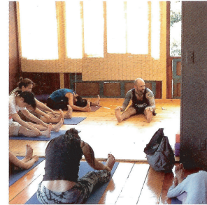
背筋を伸ばして、ゆっくりと前屈。「ひざを少しずつマットにつけるように」。深呼吸も忘れずに。