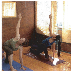
上体を開いて、指先まで意識して伸ばす。参加者全員のリズムに、一体感が生まれる瞬間が心地いい。