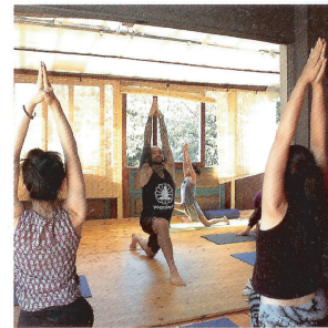
右ひざを立てた状態から、まっすぐ手を伸ばして。ひとつひとつのポーズのポイントを丁寧に指導。