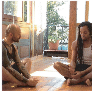
クラスの後は、先生とおしゃべりでリラックス。インターナショナルでオープンな雰囲気。